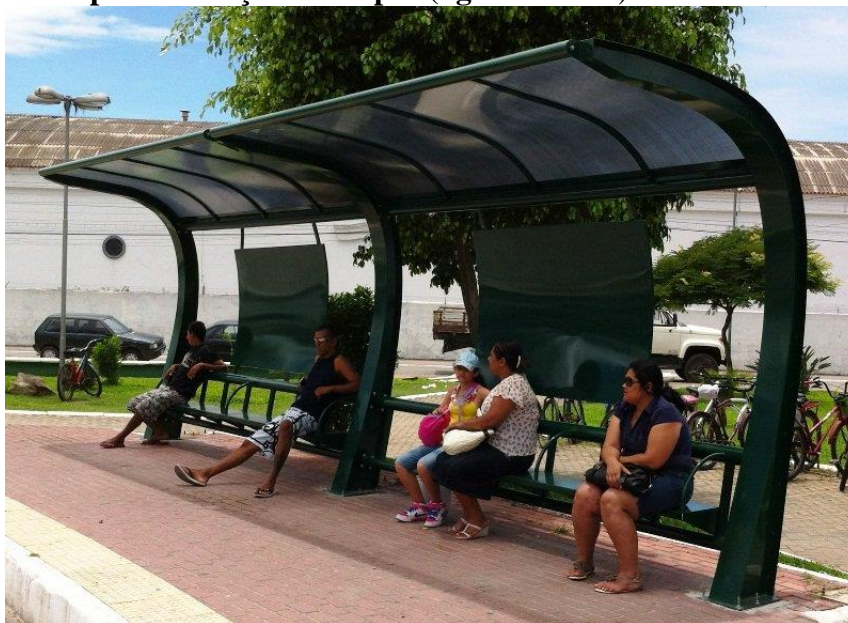
Ilustrativo1- Fundo para a fixação de cartazes/mapas-Tipo duplo