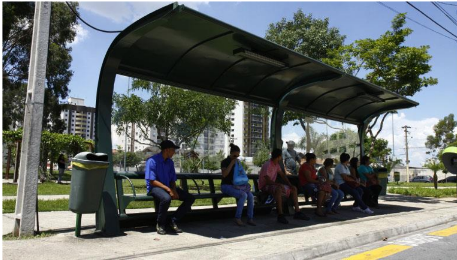
Ilustrativo 2- Cobertura Metálica/luminária/Tipo duplo

Rua José Antônio de Campos, nº 250 – Centro – CEP 11900-000 Fone (13) 3828.1000 Fax (13) 3821.2565 CNPJ – 45.685.872/0001-79