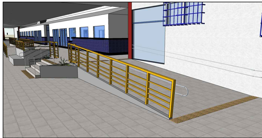
2 PERSPECTIVAS - ÁREA DE EMBARQUE E DESEMBARQUE SEM ESCALA