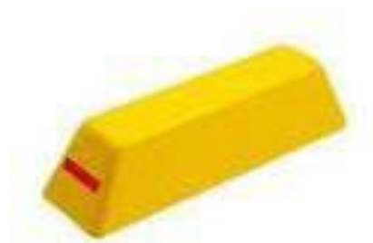
Figura A3– Segregador Extra grande (460mmx120mmx170mm), Refletivo com Pino de Fixação

NA MONODIRECIONAL, O ELEMENTO ESTÁ PRESENTE EM APENAS UM DOS LADOS.